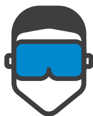
USARE GLI OCCHIALI