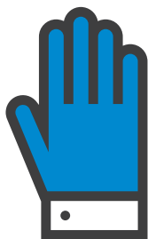
USARE I GUANTI