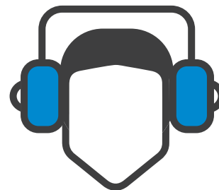
USARE LE CUFFIE

Per la riuscita "a regola d'arte" dell'intervento, dovranno essere rispettate le seguenti prescrizioni: